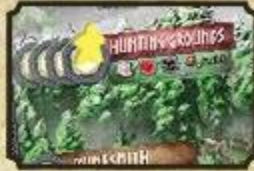
Alocação de um trabalhador nos Locais de caça

Se um jogador não pode (ou não quer) ativar uma localização no tabuleiro, eles podem pedir ajuda aos aldeões. Para isso, coloque o trabalhador no seu Tabuleiro de Líder e colete uma Comida e um Token de Culpa.