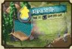
Alocação de um trabalhador no Ferreiro

(Todas ações possíveis são descritas no apêndice.)