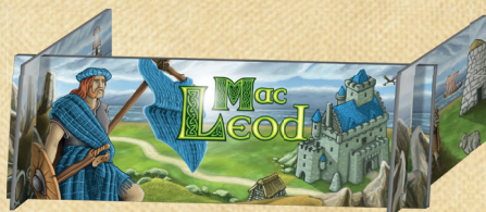
6 Escudos de Jogador (devem ser montados antes de cada partida; 1 escudo de jogador sobressalente)