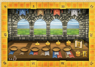
1 Tabuleiro Frente e Verso