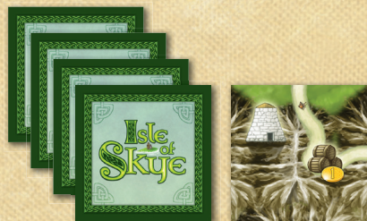
73 Peças de Paisagem (versos na cor verde)