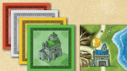
5 Peças de Paisagem com um Castelo (versos em cores diferentes)