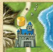
peça do castelo inicial azul

VI Coloque as peças de paisagem no saco de tecido e misture-as bem.