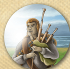
1 Marcador de Jogador Inicial