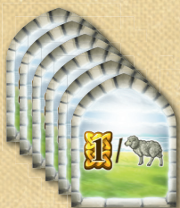
16 Peças de Pontuação (janelas)