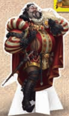
Peça do Xerife