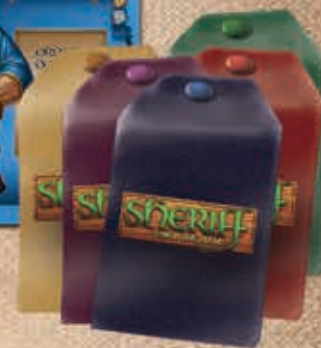
Bolsas dos Comerciantes