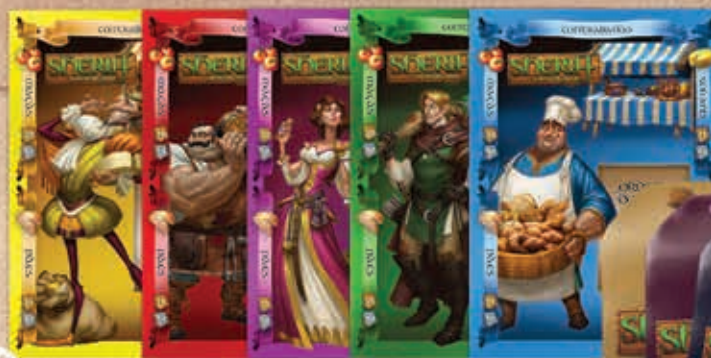
Barracas dos Comerciantes